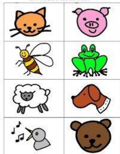
JAK MLUVÍ ZVÍRÁTKA